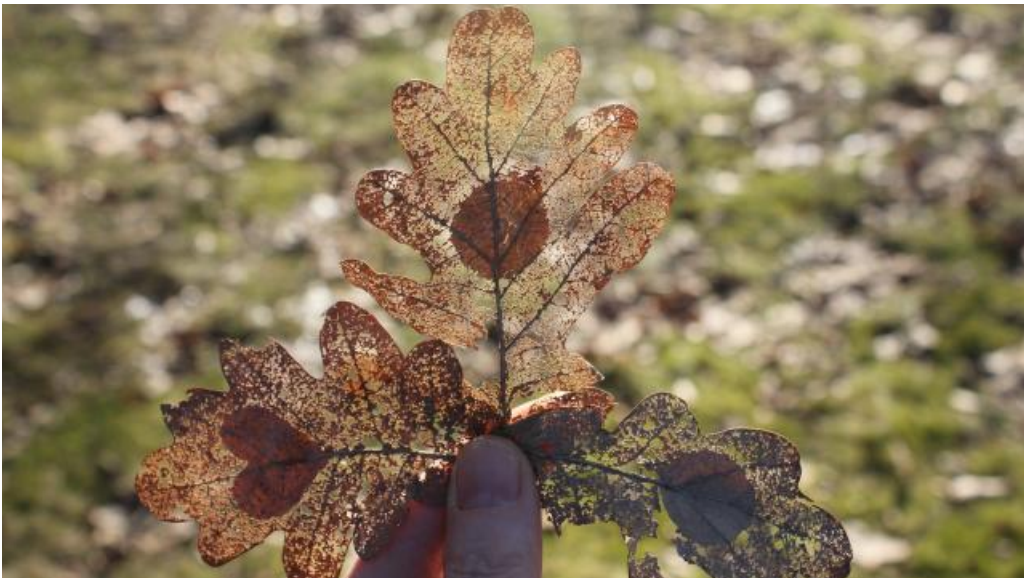
Talven yli kuivuneita tammenlehtiä pitsikuvioineen. Kuvioina pahvista leikattu sydän sekä viiden sentin kolikko.

Hiusharja ei toimi, sillä se on niin harva ja kupera, että se rikkoo lehden.