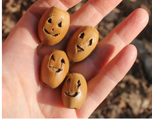
Talven yli säilyneitä halloween-terhoja.

Meillä näistä halloween-terhoista muutama on säilynyt ehjänä yli puoli vuotta. Onneksi tulee uusia syksyjä ja uusia tammenterhoja!