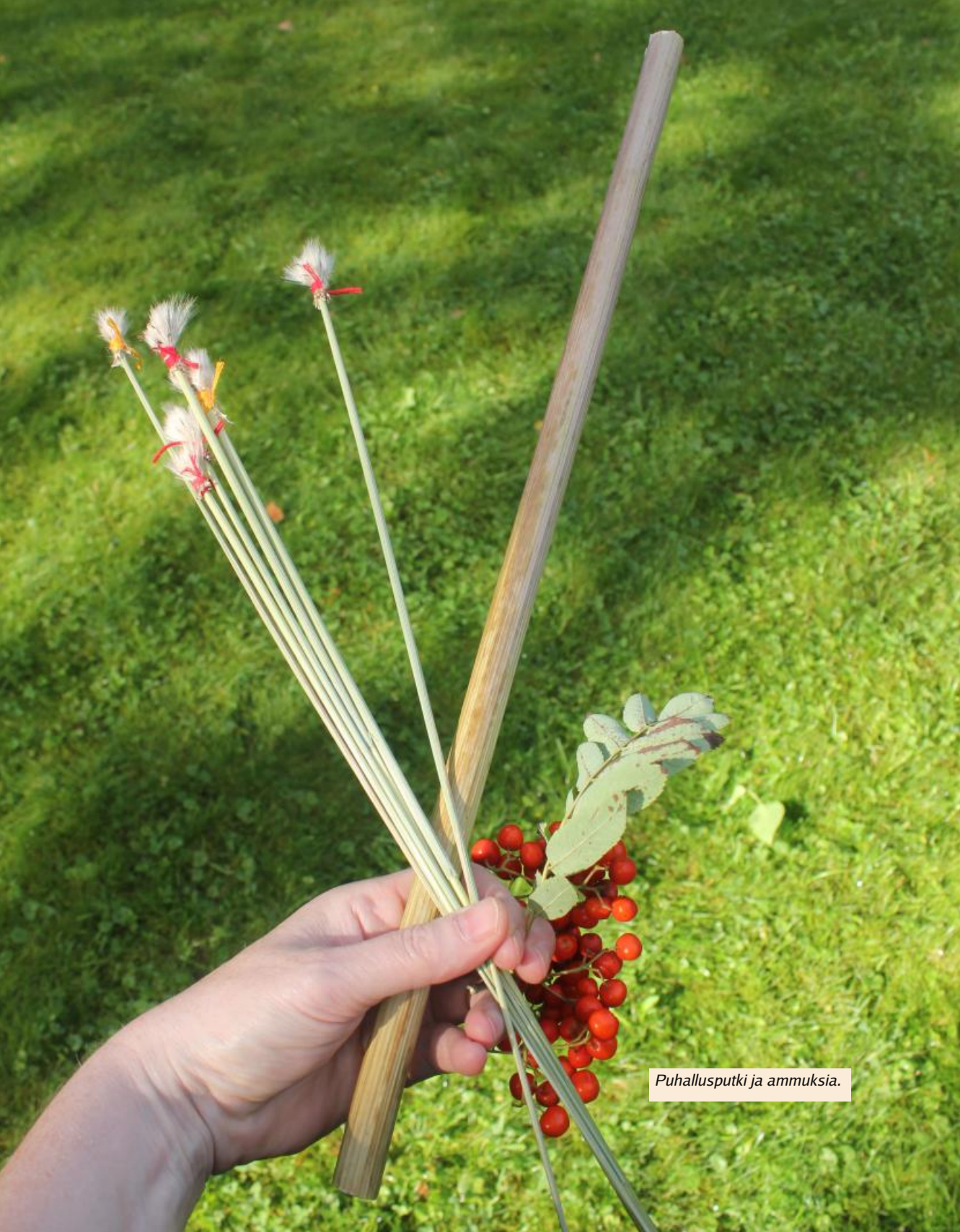
Puhallusputki ja ammuksia.