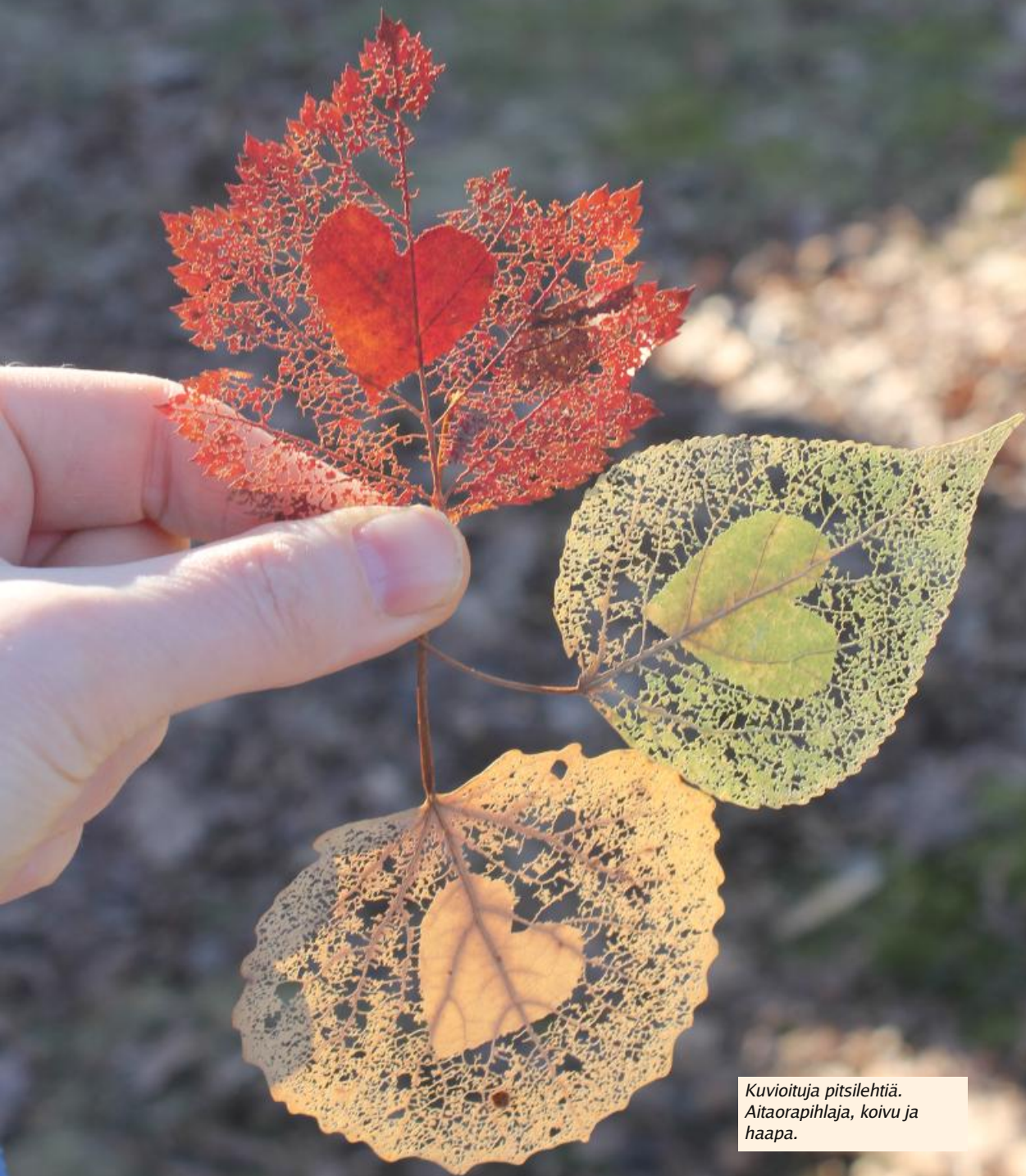
Kuvioituja pitsilehtiä. Aitaorapihlaja, koivu ja haapa.