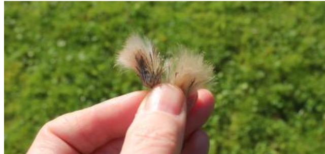
Ohdakkeen siementävä kukinto ja irti nypitty haiventuppo.

Jos käyttää erivärisiä kirkkaita naruja, voi pitää tarkkuusammuntakilpailunkin.