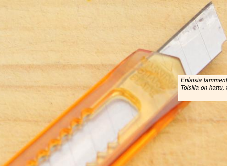
Erlaisia tammenterhoja. Toisilla on hattu, toisilla ei.