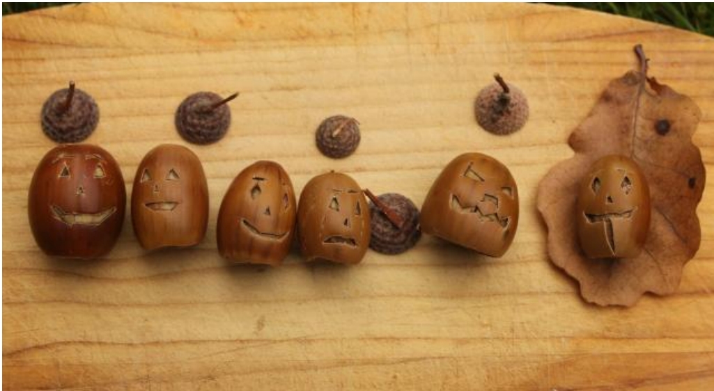
Erlaisia tammenterhoja. Toisilla on hattu, toisilla ei.