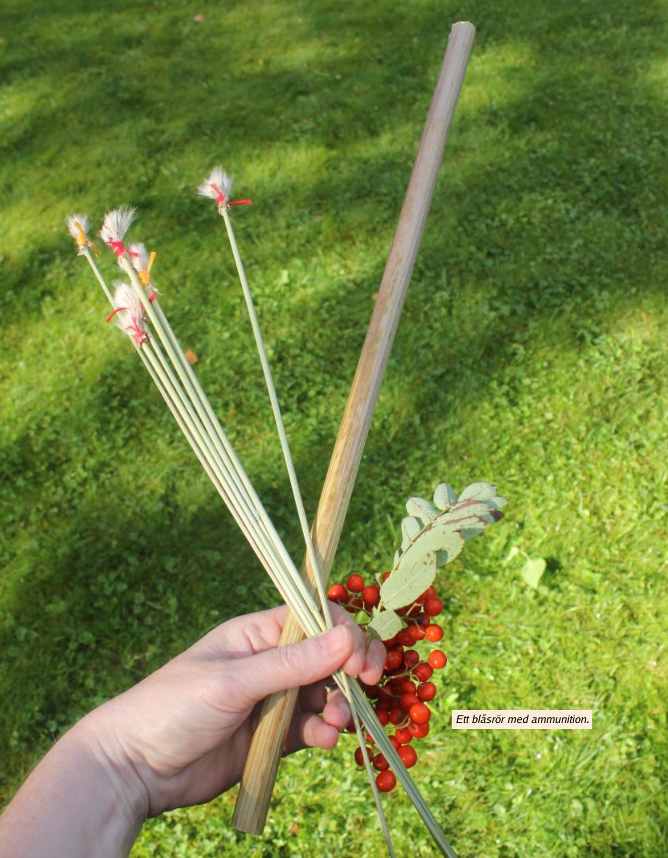
Ett blåsrör med ammunition.