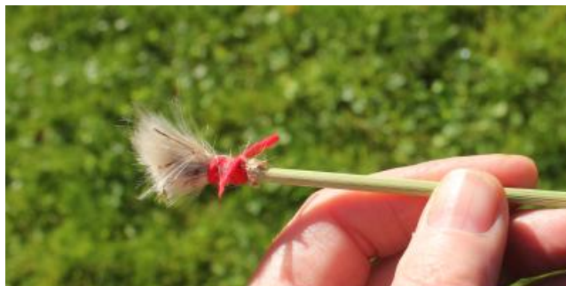
Tistelfrön fastbundna i pilens ände.