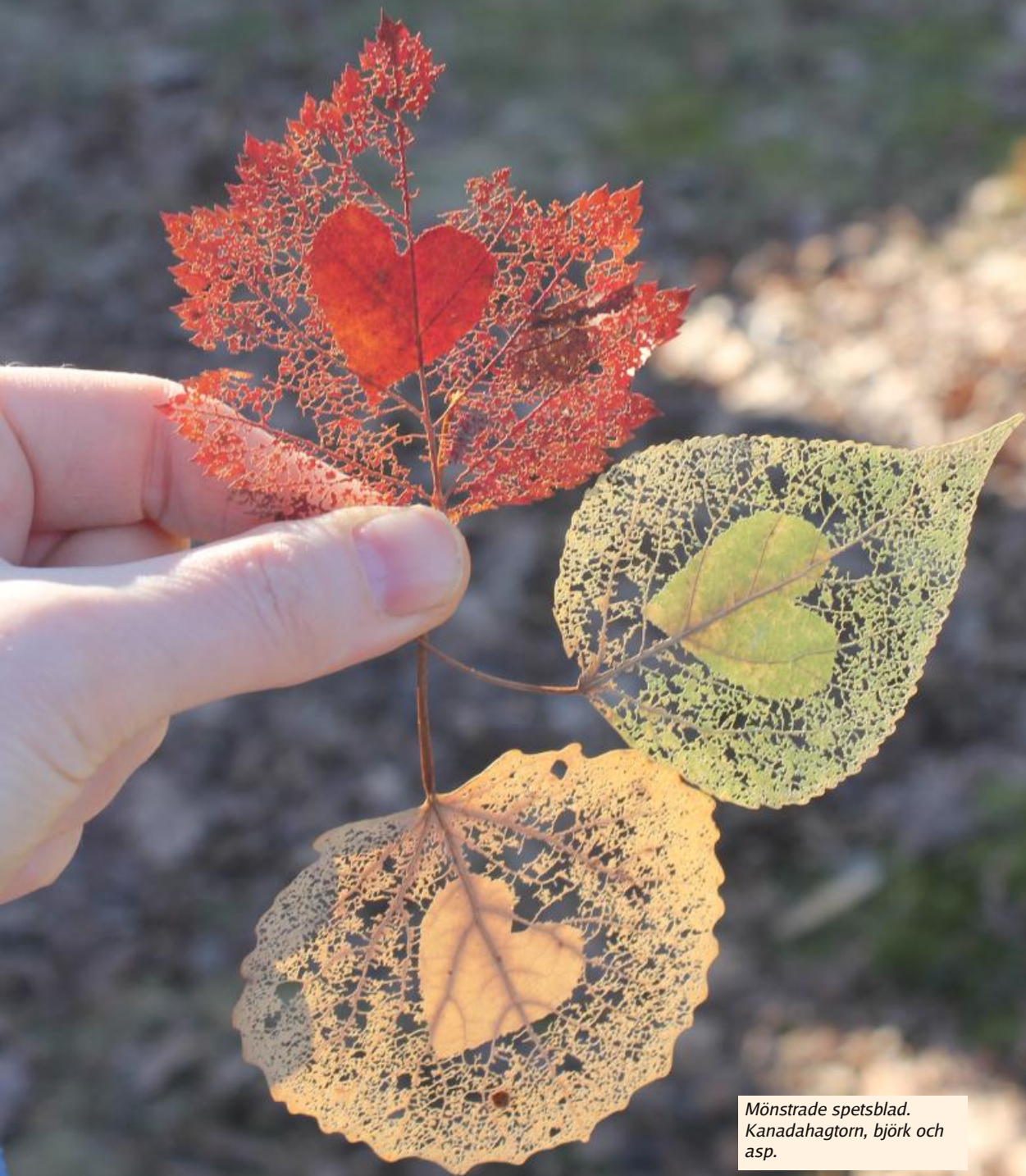
Mönstrade spetsblad. Kanadahagtorn, björk och asp.