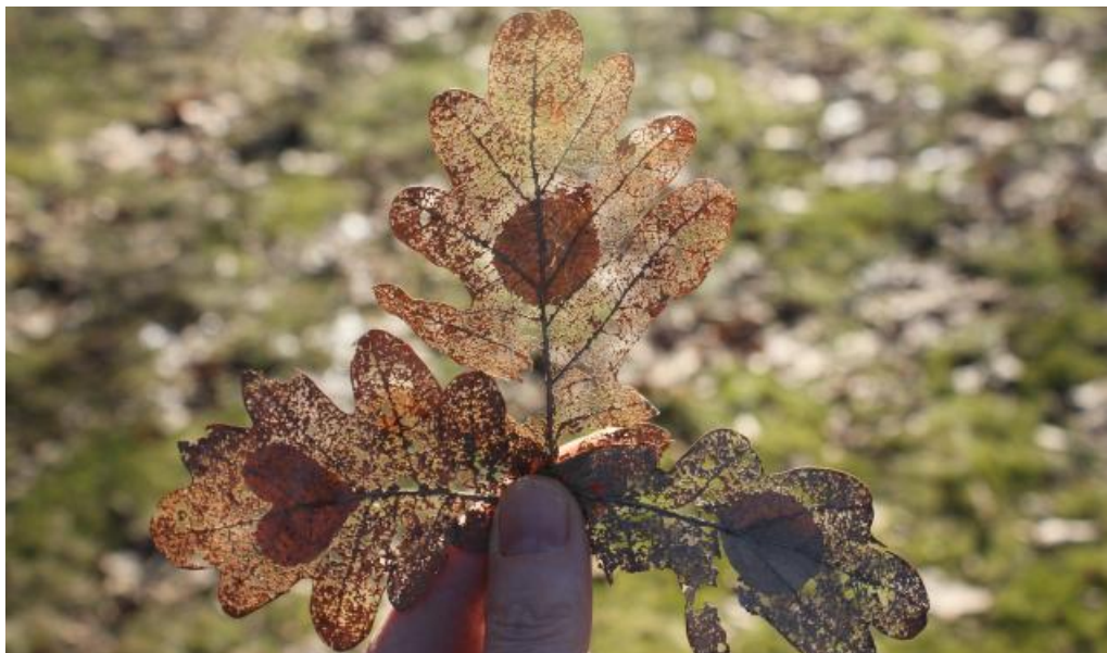
Fjolårets eklöv blev mönstrade spetsblad på våren. Mönstret är en hjärtformad kartongbit och en liten slant.

En vanlig hårborste duger inte. Den är för gles och rund och söndrar därför lövet helt.